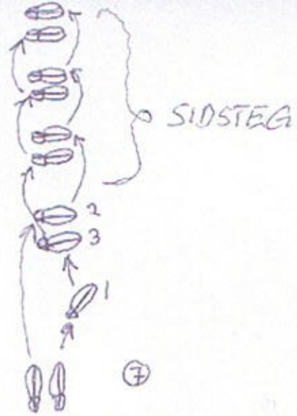
FÖRSTA ZICK-ZACKSIEGET + 3 SIDSTEG