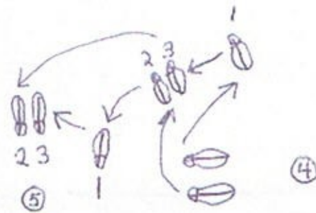
KAV-VÄNSTER FOT KAV HÖGER FOT